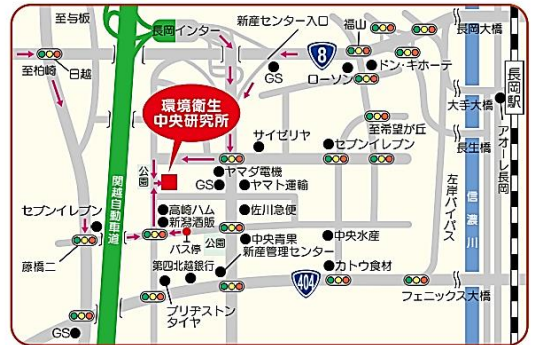
当所までのアクセス